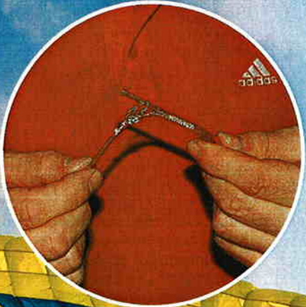
Innerste A-Stamtleine an der Naht circa 4 Zentimeter aufgetrennt.