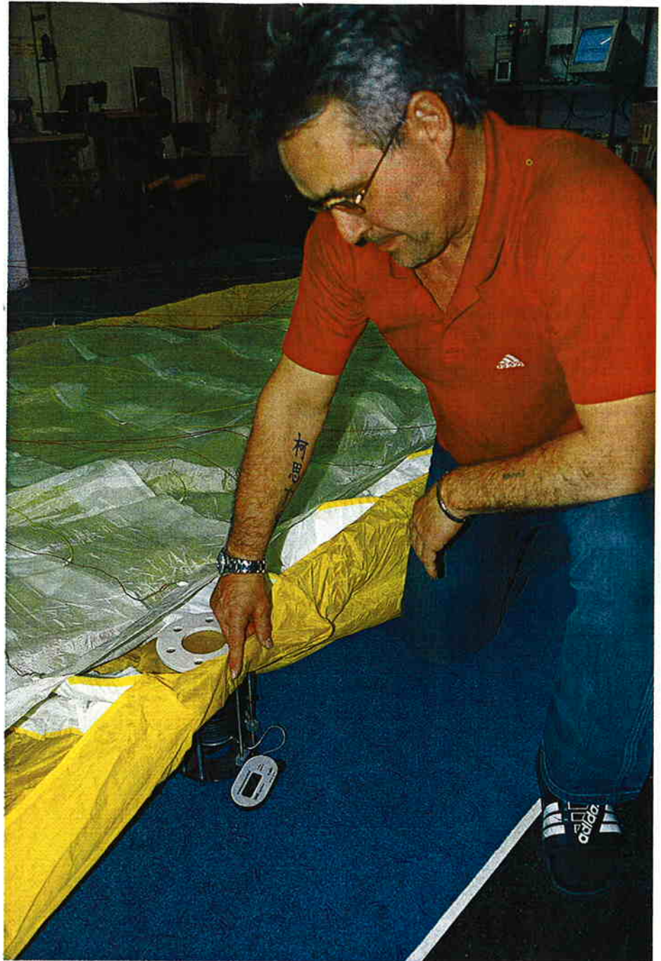
„Der Schirm ist k.o.“: Einer der drei „X-Acts“ fiel bei der Porositätsmessung durch.

arbeiten, werden auch mal Fehler gemacht. Trotzdem ist natürlich bei einem Fluggerät höchste Sorgfalt angebracht: Schließlich hängen Sie mit Ihrem Leben daran!