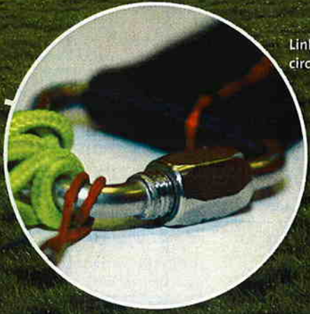
Linkes D-Leinenschloss circa 2/3 aufgedreht.